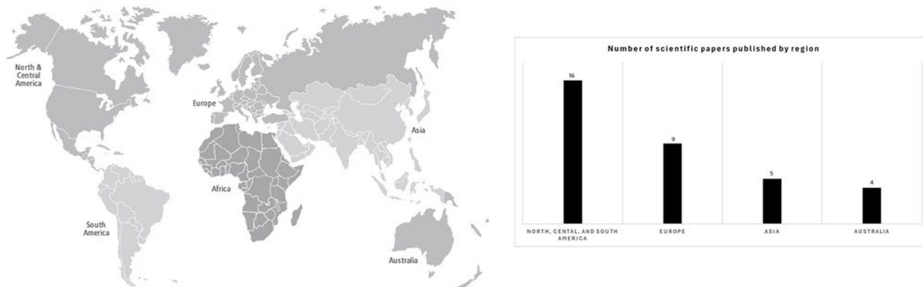
Figura 2. Gráfico de distribuição geográfica dos estudos incluídos na pesquisa